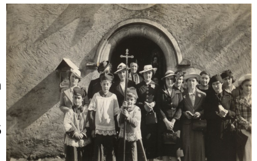
une sortie de messe à la chapelle en 1941

Cette année, vous êtes invités à la messe qui aura lieu comme d'habitude à 10 heures .