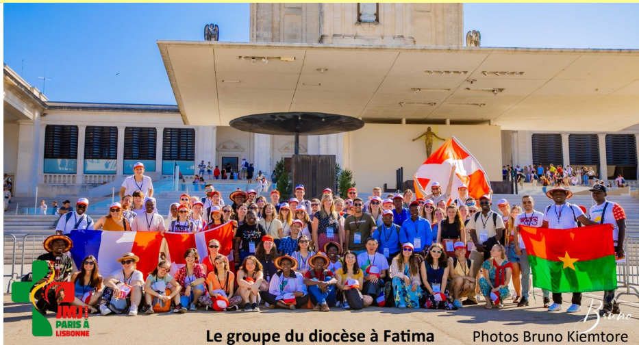
Le groupe du diocèse à Fatima

Les Journées Mondiales de la Jeunesse 2023 ont été l'événement le plus attendu par les quelques 81 jeunes des diocèses de Chambéry, Tarentaise et Maurienne, dont 10 Burkinabès venus de Ouagadougou.