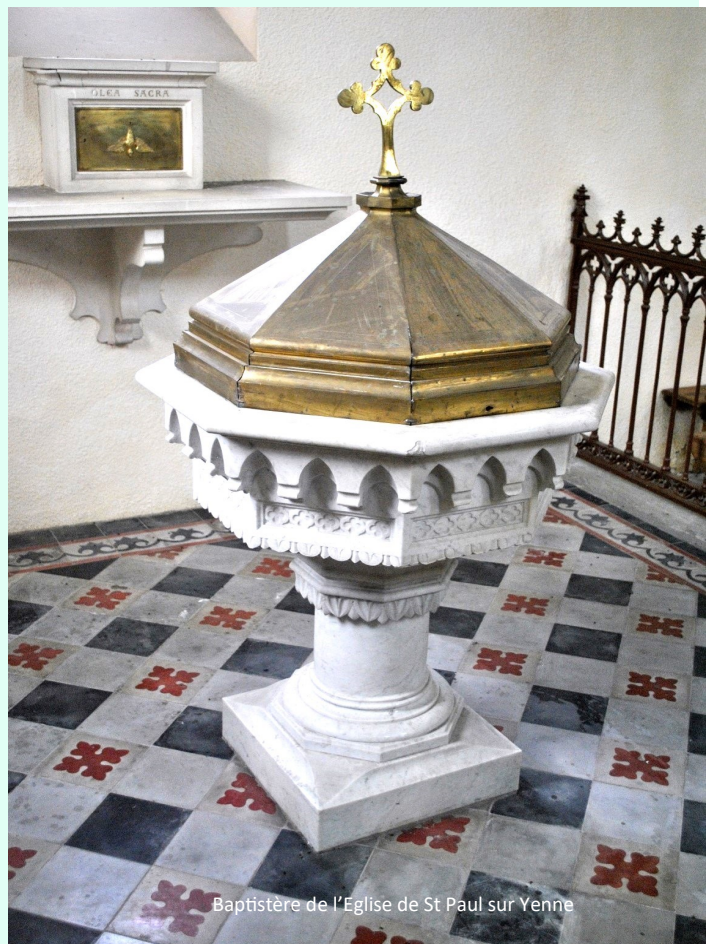
Baptistère de l'Eglise de St Paul sur Yenne