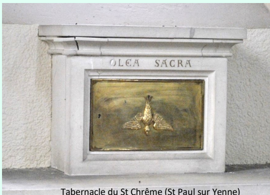
Tabernacle du St Chrême (St Paul sur Yenne)

J'aime ces rencontres au cours desquelles je mets enfin un visage sur une voix, entendue plusieurs semaines auparavant.